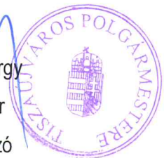
Dr. Fülöp György polgármester meghatalmazó

alpolgármester, önkormányzati képviselő meghatalmazott