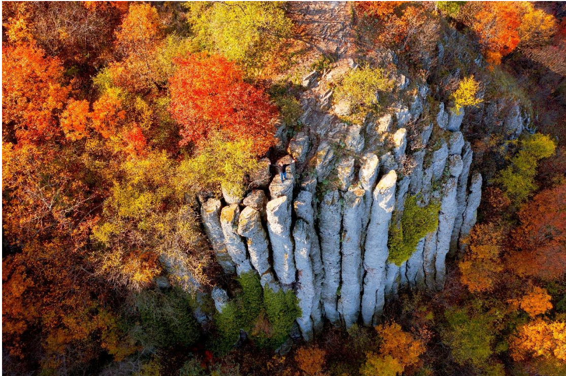
Balaton-felvidék, Szent György-hegy

Bizonytal mindenkinek van olyan emléke, amikor egy meleg, nyári estén kiheveredett a fűre és csak bámult fel a csillagokkal teleszórt égre. Ha ilyenkor odafeküdt mellénk valaki, akinek a kezét is megfoghattuk, vagy aki el tudott igazítani bennünket a fénylő pontok összevisszaságában, akkor igazán szerencsésnek érezhettük magunkat.