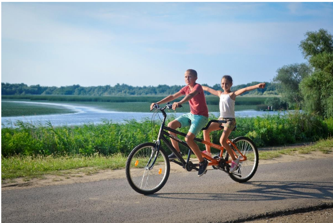
Kerékpár - Fot. Magyar Turisztikai Ügynökség