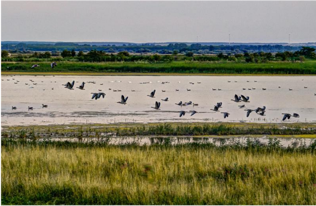
Fertő táj