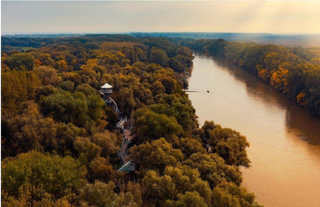
Makó, lombkorona sétány

hagyma városa egy különleges attrakcióval állt elő: a tanösvényt itt hagymakupolás tornyok szakítják meg, s ezek egyikéből, 18 méter magasról még egy csőcsúszdán is le lehet lecsúszni. Igazán különleges a Pannonhalmán épített, hal formájú, illetve a Gerecse kör alakú lombkorona-sétánya, mely utóbbiak babakocsival és kerekesszékekkel is bejárhatók.