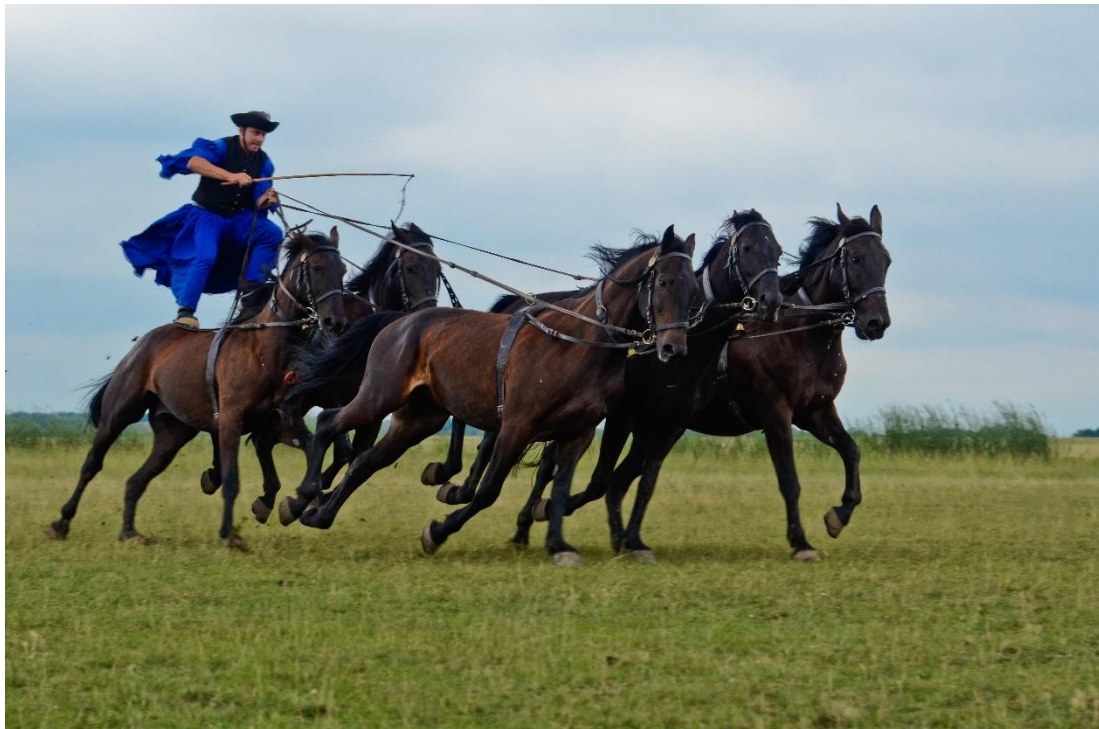
Hortobágy puszta ötös