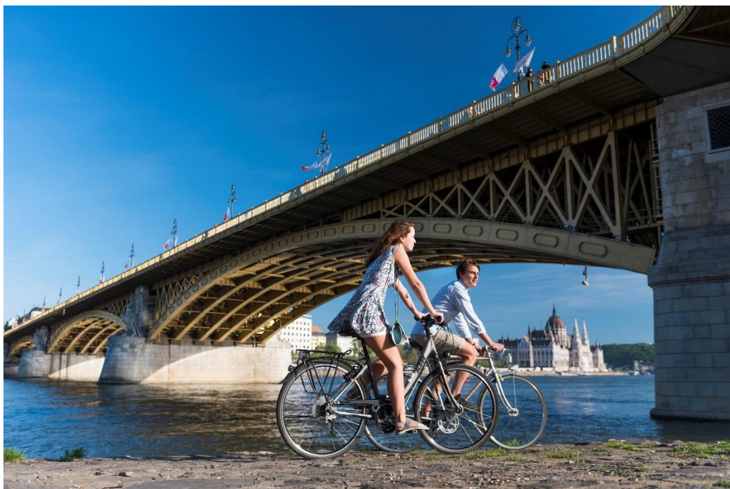
Kerékpár Budapest