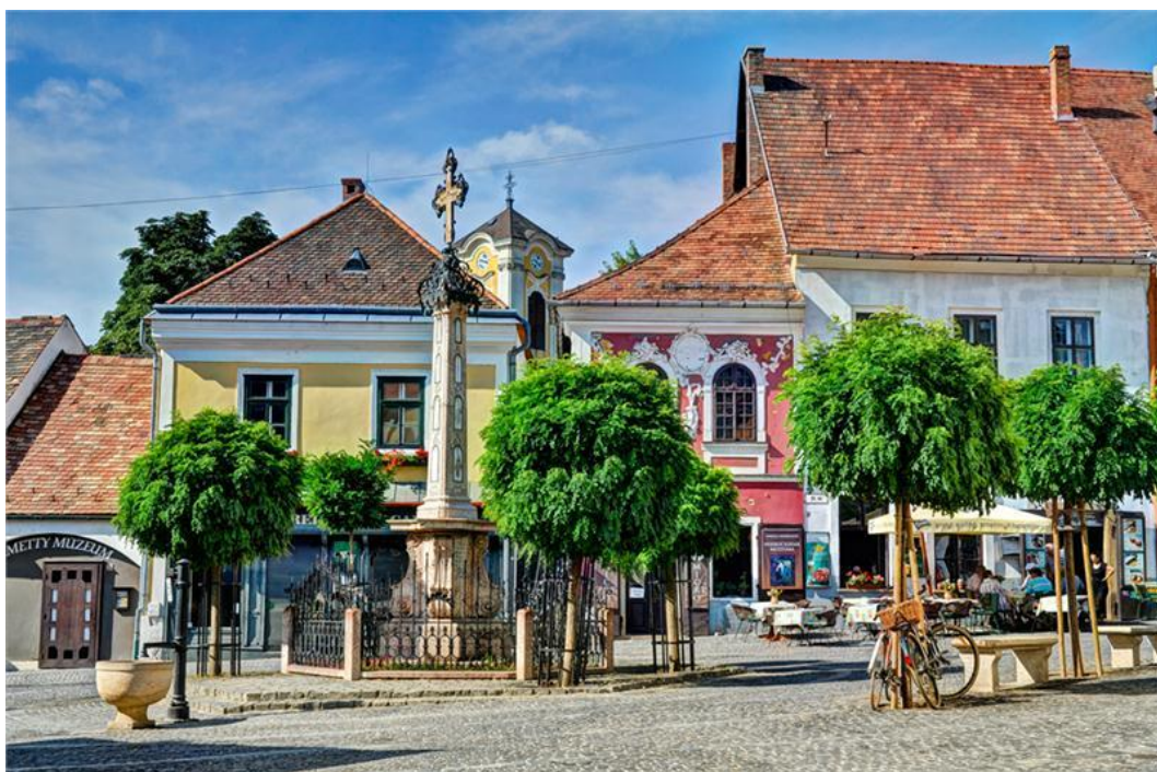
Szentendre - Fot. Magyar Turisztikai Ügynökség