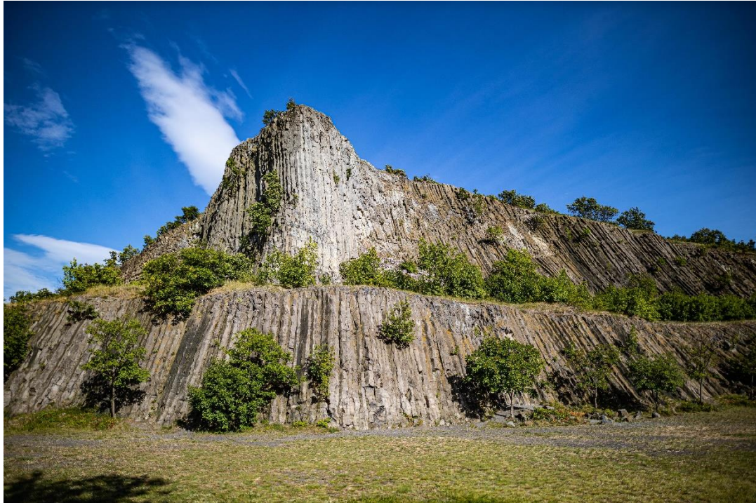
Balaton-felvidék, Hegyestű kilátó