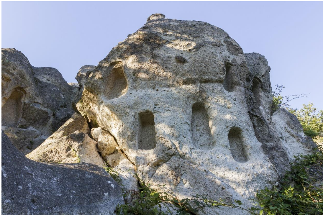
Bükk kaptárkövek