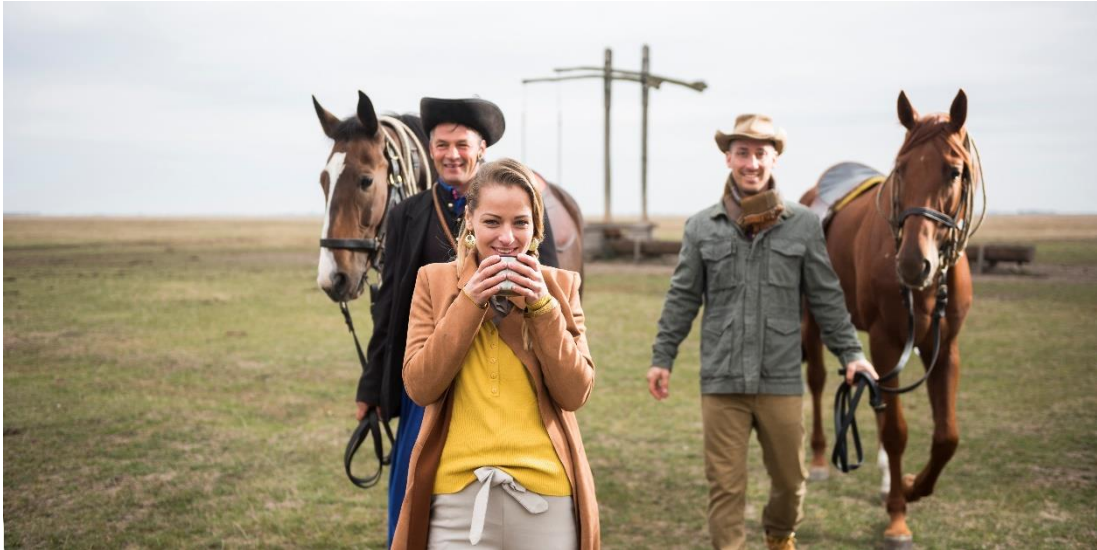
Lovas turizmus