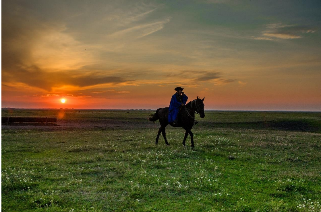
Hortobágy csikós

szálláshelyeket, lovasprogramokat országszerte szinte mindenütt kínálnak, az infrastruktúra fejlesztésének tekintetben Észak-Magyarország és az Észak-Alföld fejlődik a legdinamikusabban. Ezekben a régiókban - uniós segítséggel - nemrégiben egy 1800 kilométer hosszú, 31 lovasturisztikai megállóval gazdagított lovas útvonalhálózat épült ki.