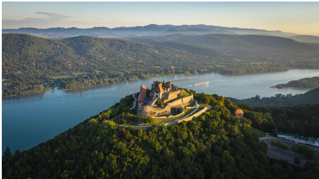
Dunakanyar Visegrád