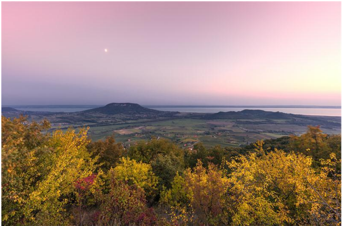
Balaton-felvidék, Badacsony