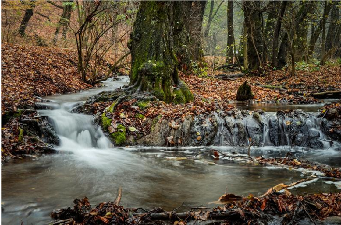
Bükk, Szalajka-völgy Szilvasvarad

Szintén egy híres, törökországi helyszínt, Pamukkálét idézi a közeli Egerszalók, ahol a föld mélyéből feltörő, a domboldalon lefolyó, ásványokban gazdag hőforrás látványos, teraszos mészkőlerakódást épített. Maga a „sódomb” ugyan védett, így a teraszokra nem lehet felmászni, ám a közeli gyógyfürdő medencéiben kellemesen elmerülhetünk a gyógyvízben.