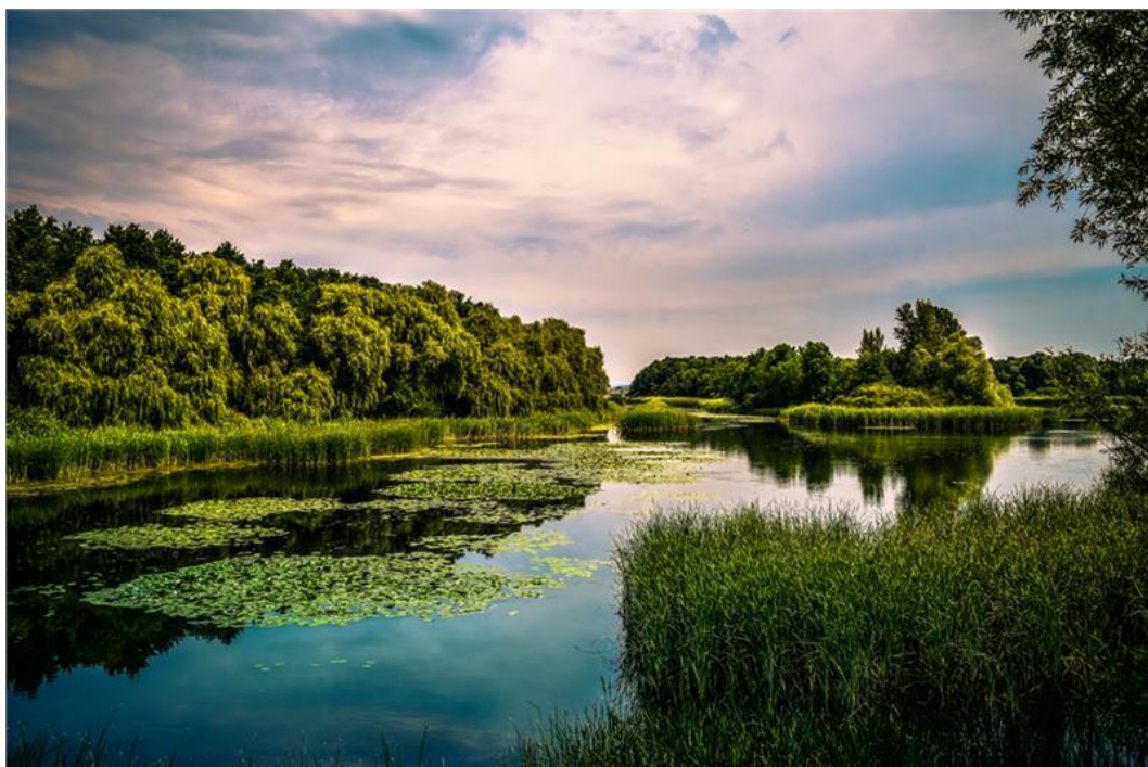
Balaton, Kis-Balaton - Fot. Magyar Turisztikai Ügynökség