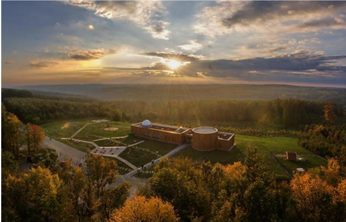
Zselic csillagpark