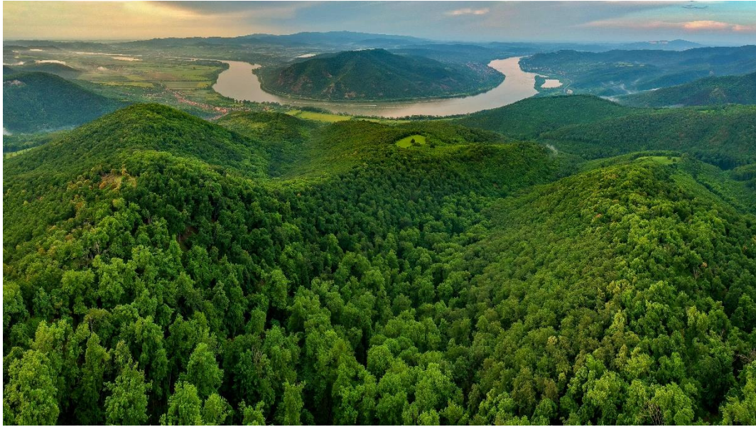
Dunakanyar Prédikálószték - Fot. Magyar Turisztikai Ügynökség