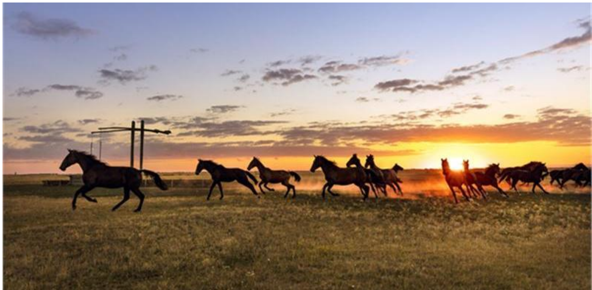
Hortobágy naplemente