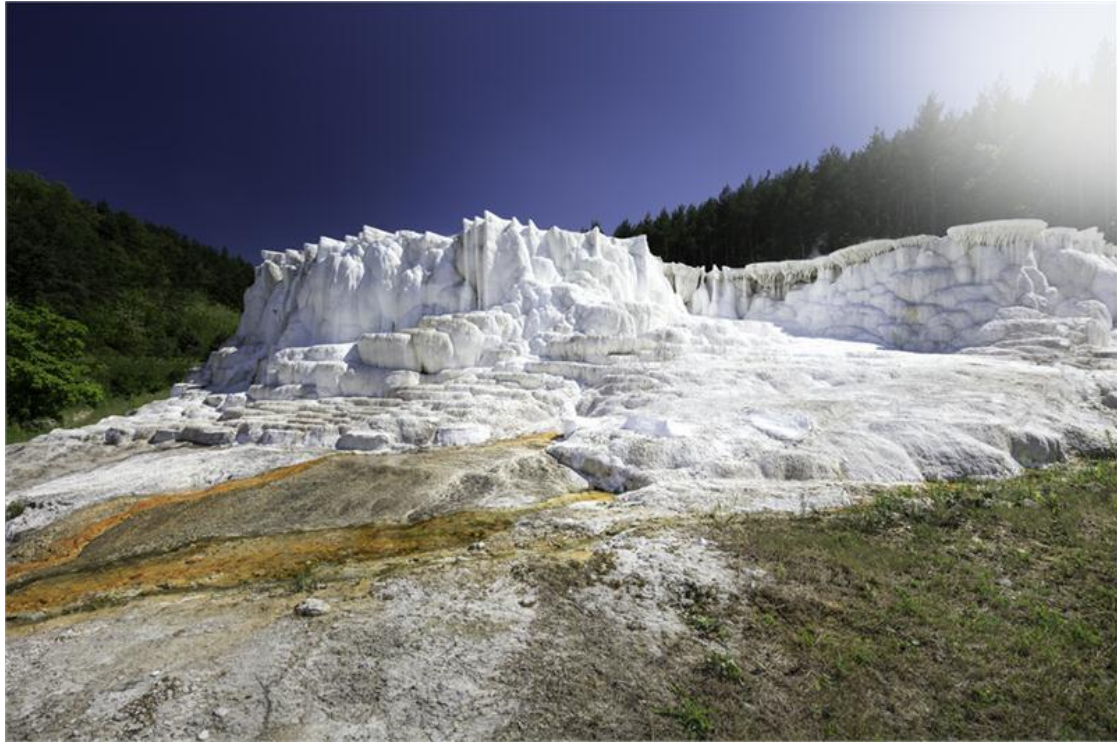
Egerszalók sódomb