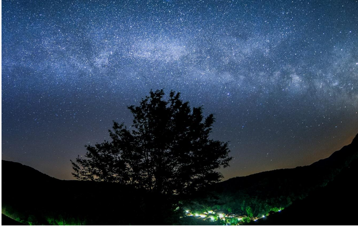
Répáshuta tejúttal

teleszkópja és egy naptávcső, a Planetáriumban pedig 3D-s ismeretterjesztő filmeket is nézhetnek majd a látogatók. Természetesen ma már a VR-élmények sem maradhatnak ki a kínálatból, így speciális szemüveg segítségével repülhetünk a marsi kanyonban is, vagy sétálhatunk a Hold felszínén. Aki viszont biztos talajt szeretne érezni a talpa alatt, az vágjon neki inkább a 4 kilométer hosszú, rendkívül érdekes csillagászati tanösvénynek!