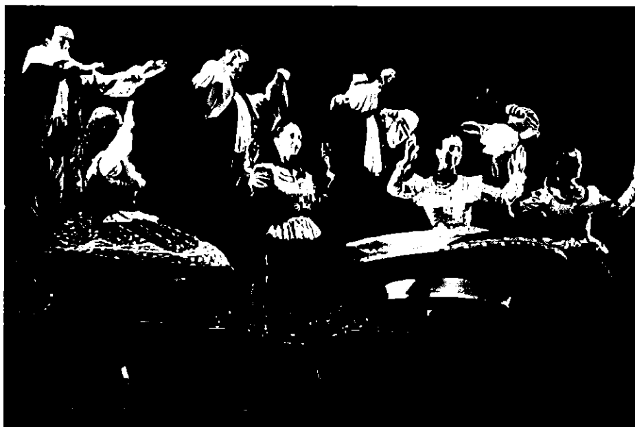
A Magyar Nemzeti Táncegyüttes

Bartók és Kodály életművének máig legfontosabb üzenete a magyar népi kultúrában rejlő értékek felfedezése és éltetése, újrafelfedezése és tovább örökítése. A fesztivál megértette az üzenetet: két gyermekien játékos Kodály-művet, Hány János meséjét (Hány szvit) és a Páva-variációkat állította színre a Miskolci Szimfonikus Zenekar és a Magyar Nemzeti Táncegyüttes közreműködésével.