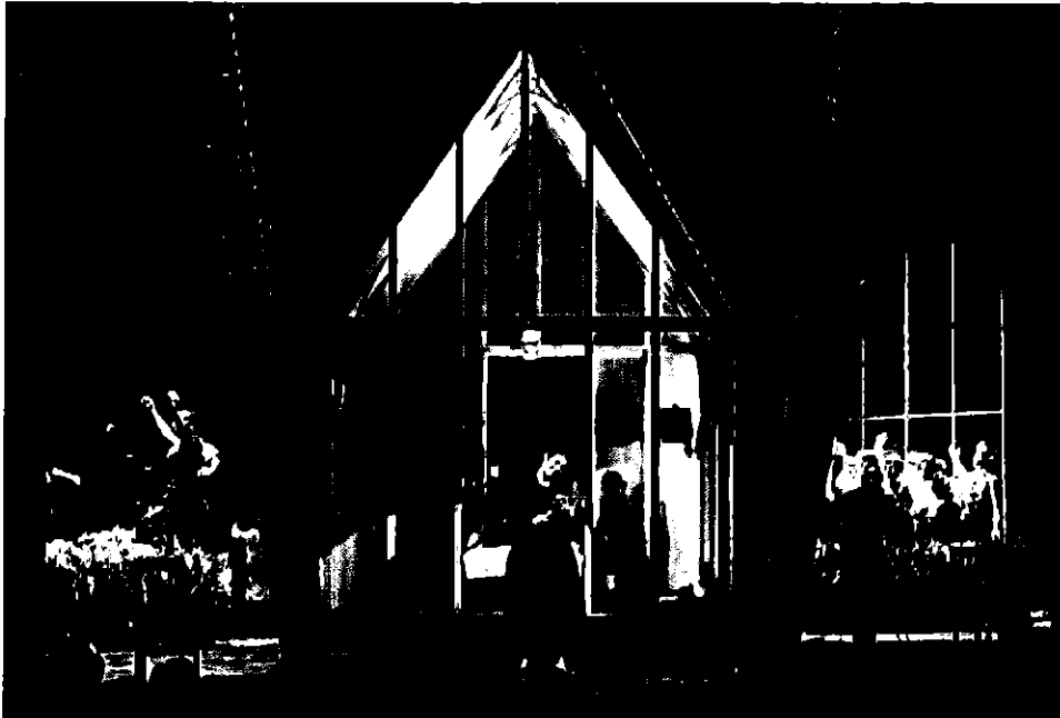
A Magyar Állami Operaház vendégjátéka

A Magyar Állami Operaház vendégjátéka 2017. június 22. 19.30 óra – Miskolci Nemzeti Színház, Nagyszínház – valamint élő led falas közvetítés a Szt. István téren