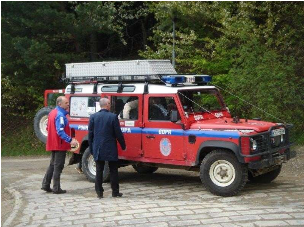
A hegyi mentők

A délutáni program a város központjával szemben álló hegyen a 37 méter magas jubileumi kereszt megtekintése volt. Mivel kisbuszunk nem volt képes a felfelé vezető meredő utat megtenni, ezért a polgármester úr kérésére a hegyimentő szolgálat terepjárója vitt fel bennünket több fordulóval.