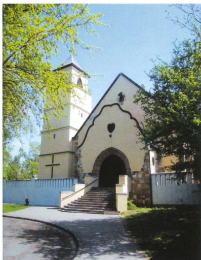
Uroczysta intronizacja relikwii krwi św. Jana Pawła II

Szent II. János Pál pápa vérereklyéjének ünnepélyes fogadása. 2015. szeptember 20-án 10.30 órai kezdettel a Lengyel Templomba.