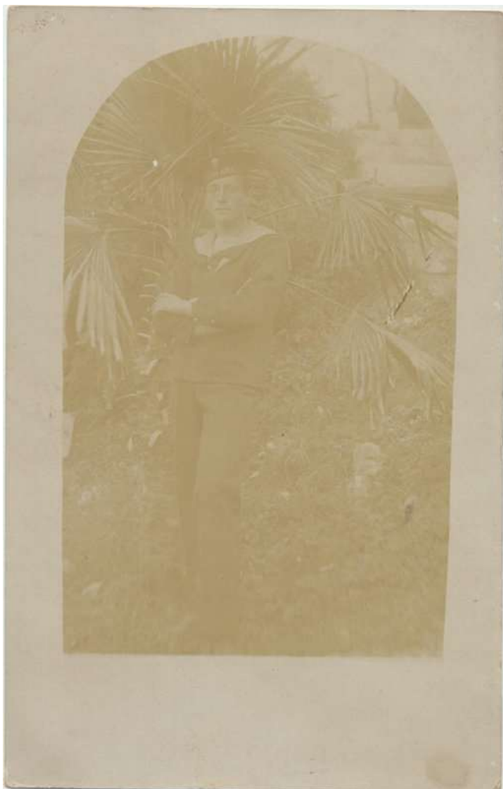
Nadawca wspomnianej karty pocztowej – marynarz z fregaty SMS Adria. Brak bliższych informacji co do tej jednostki, jedynie rok 1856 (rok wejścia do służby?)